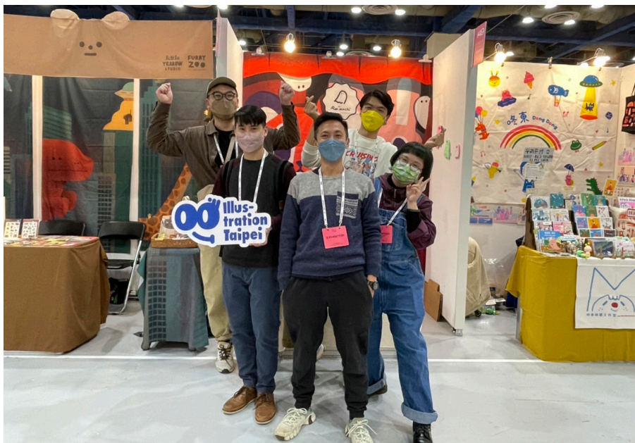
▲ Raimochi、小黃間 little yellow studio、咚東 // Dong 2 為 2022 年台北畫博 IN 首爾團隊，參加 12 月的 The Seoul Illustration Fair (首爾插畫節)。

「國際交流」與「創造商機」是台北畫博的兩大重心，除了邀請數百位國內買家進場外，首屆台北畫博也與韓國「The Seoul Illustration Fair (首爾插畫節)」結盟，以行動支持台灣創作者踏出國際舞台的一步。