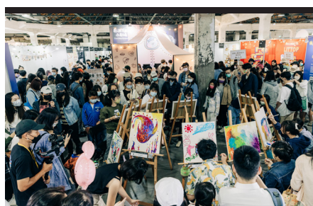
▲ 插畫大舞台 vs 粉絲見面會