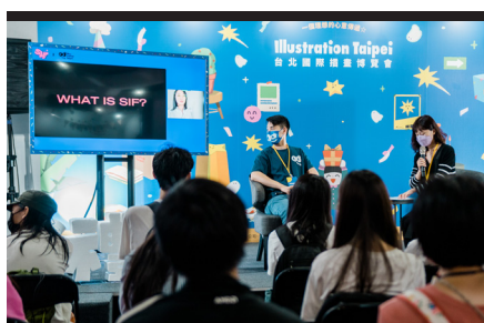
▲ 亞洲插畫高峰論壇